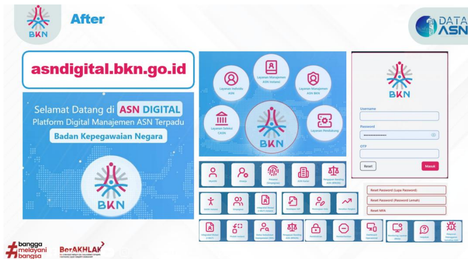
Gambar 3. Tampilan ASN Digital

Sebelum implementasi ASN Digital, layanan kepegawaian masih dijalankan melalui berbagai aplikasi yang berdiri sendiri sehingga belum terdapat integrasi yang menyatukan seluruh layanan dalam satu platform. Kondisi tersebut menyebabkan proses pelayanan kurang efisien karena pengguna harus mengakses aplikasi yang berbeda untuk setiap jenis layanan.